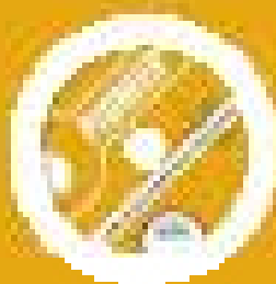
Teacher's Resource CD/CD-ROM with tests and extra material