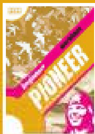
Full-colour Workbook (also available with key booklet)