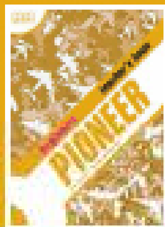
Interlevel Teacher's Book