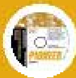
Interactive Whiteboard Material